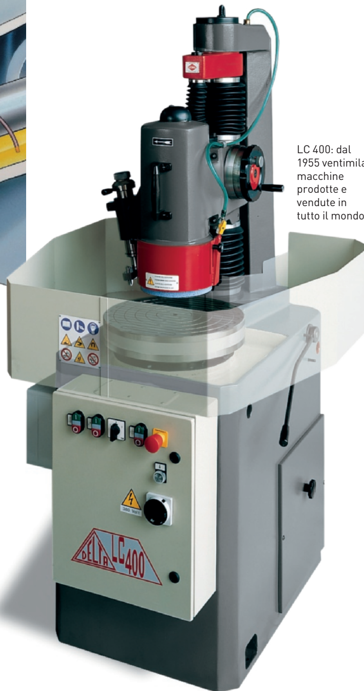
LC 400: dal 1955 ventimila macchine prodotte e vendute in tutto il mondo.

Rispondiamo fondamentalmente con le nostre macchine, contraddistinte da soluzioni tecniche in grado di soddisfare le diverse esigenze di oggi. Rappresentativo fra tutti, a tale proposito, è il sistema idrostatico di cui le nostre rettificatrici sono dotate, che consente alla geometria di macchina di rimanere costante nel tempo. Non subendo usura grazie alla presenza del sistema idrostatico, le nostre macchine sono quindi potenzialmente eterne. E chi effettua un investimento importante come quello relativo a una macchina utensile vuole che sia duraturo nel tempo, così come i suoi risultati. Anche in un'ottica di controllo e di versatilità, per esempio, rispondiamo adeguatamente alle odierne esigenze di clienti e mercato, grazie allo sviluppo software effettuato al nostro interno su controlli di primarie marche, che ci permette di ottenere un'interfaccia estremamente semplice e funzionale, a tutto vantaggio dell'operatività delle macchine e del lavoro degli addetti.