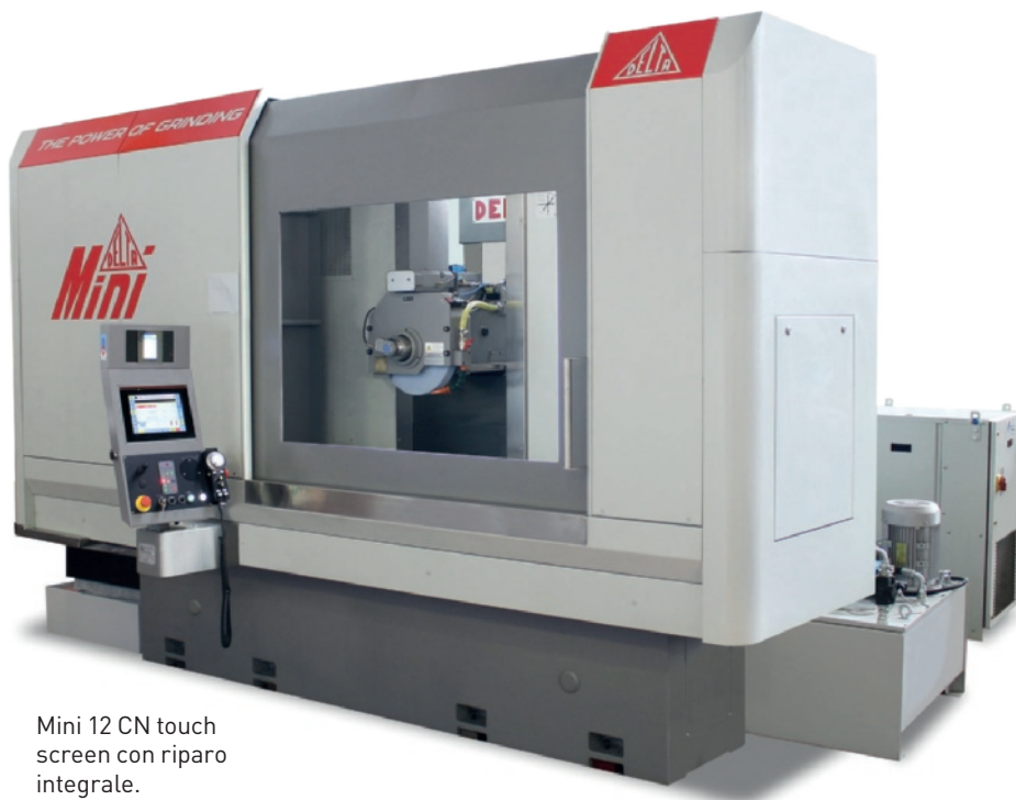
Mini 12 CN touch screen con riparo integrale.

Specializzata nella realizzazione di rettificatrici per superfici piane ad alta tecnologia, Delta si contraddistingue per la precisione e l'affidabilità della sua intera produzione, oltre che per il servizio di assistenza puntuale e competente. Ma al di là di questo, sono proprio le soluzioni tecniche e la loro analisi precisa, di cui ho appena parlato, a differenziarci sul mercato. Montante mobile, sistema idrostatico e mandrino idrodinamico sono i nostri tre punti di forza, in grado di fare la differenza in ambito tecnologico.