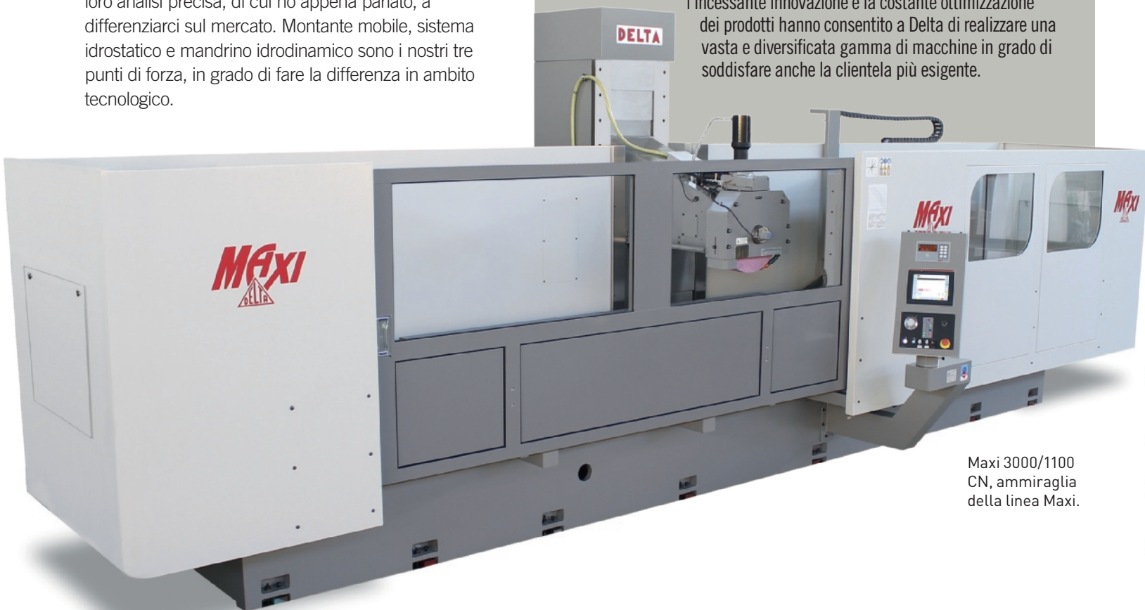
Maxi 3000/1100 CN, ammiraglia della linea Maxi.

Dal 1955 Delta si occupa con successo della progettazione e costruzione di rettificatrici per superfici piane ad alta tecnologia. Altrettanto nota per la sua gamma di lapidelli, l'azienda si caratterizza per la precisione e l'affidabilità che contraddistinguono la sua produzione, unitamente a un'esperienza di 63 anni nel settore che le ha permesso di affermarsi e consolidare la propria presenza sul mercato nazionale e su quello internazionale. L'utilizzo delle più moderne tecnologie, la continua ricerca, l'incessante innovazione e la costante ottimizzazione dei prodotti hanno consentito a Delta di realizzare una vasta e diversificata gamma di macchine in grado di soddisfare anche la clientela più esigente.