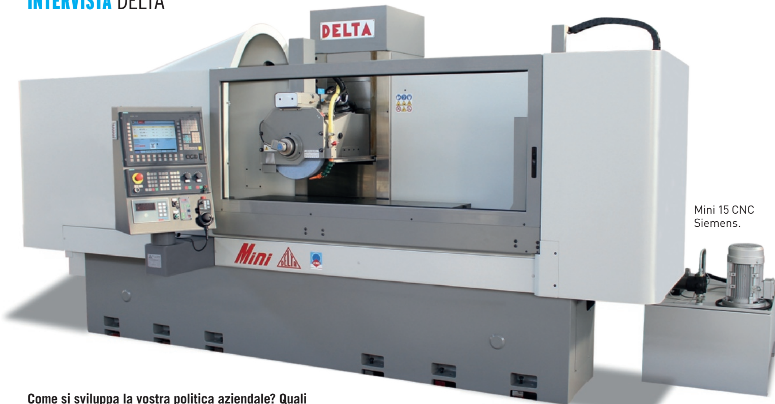
Mini 15 CNC Siemens.