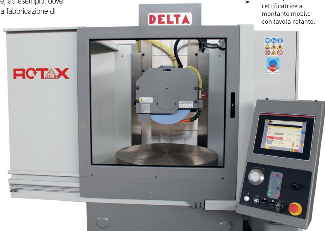
Rotax 9, rettificatrice a montante mobile con tavola rotante.

Delta è una realtà nata nel 1955 e ancora saldamente sul mercato: se in questi 63 anni, e fin dalle nostre origini, non avessimo prodotto qualità non saremmo probabilmente arrivati a tale durata e, oltretutto, con un'unica proprietà, il che rappresenta senz'altro un'ulteriore garanzia di continuità e costanza di tale