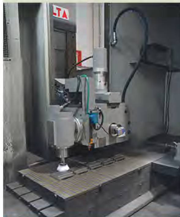
Particolare della testa porta-mola e del mandrino verticale che permette di eseguire lavorazioni molto particolari

Dal 1955 Delta si occupa della progettazione e della costruzione di rettificatrici per superfici piane a montante mobile ad alta tecnologia, con una gamma tra le più ampie del mercato, con ben 15 modelli e 3 livelli di automazione. Altrettanto nota per la sua gamma di lapidelli, con oltre 20.000 unità vendute in oltre 60 anni di attività, l'azienda si caratterizza per la precisione e l'affidabilità che contraddistinguono la sua produzione, unitamente a una ben longeva esperienza maturata nel settore che le ha permesso di affermarsi e consolidare la propria presenza sul mercato nazionale e su quello internazionale. Altro tratto distintivo riguarda l'assistenza tecnica pre e post-vendita, puntuale, meticolosa e competente, con ricambi pronti a magazzino, anche per la revisione di macchine datate; da segnalare inoltre lo sviluppo sempre al proprio interno di tutto il software di gestione delle proprie macchine. Concessionaria del marchio Ucimu e classificata Rating 1 dalla Dun & Bradstreet, Delta è certificata ISO 9001.